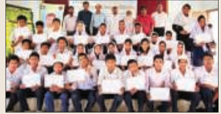
প্রশিক্ষণার্থী ও অতিথিবৃন্দ