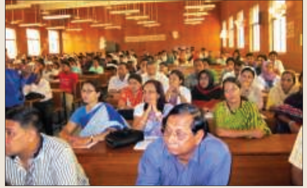
সেমিনারে অংশগ্রহণকারী কুমিল্লা মেডিক্যাল কলেজের অধ্যাপক ও ছাত্রছাত্রীরা