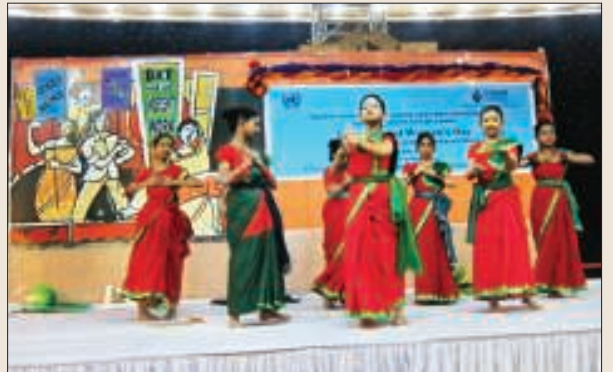
সাংস্কৃতিক অনুষ্ঠানের একটি দৃশ্য