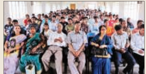
অনুষ্ঠানে অংশগ্রহণকারী অতিথি ও ছাত্রছাত্রীরা